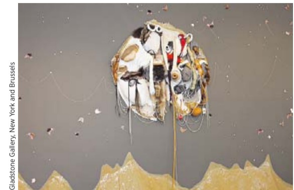
Gladstone Gallery, New York and Brussels

Dass sie eine deutsche und nicht eine amerikanische Bank unterstützt, wundert Mutu gar nicht. Es sei für sie leichter, sich mit Europäern zu verständigen als mit Amerikanern, sagt Mutu. „Traditionell gibt es eine engere Verbindung zwischen Europa und Afrika, schon durch die größere räumliche Nähe. In Europa herrscht einerseits das schlechte Gewissen wegen des Kolonialismus und andererseits auch echtes Interesse an zeitgenössischen Entwicklungen.“