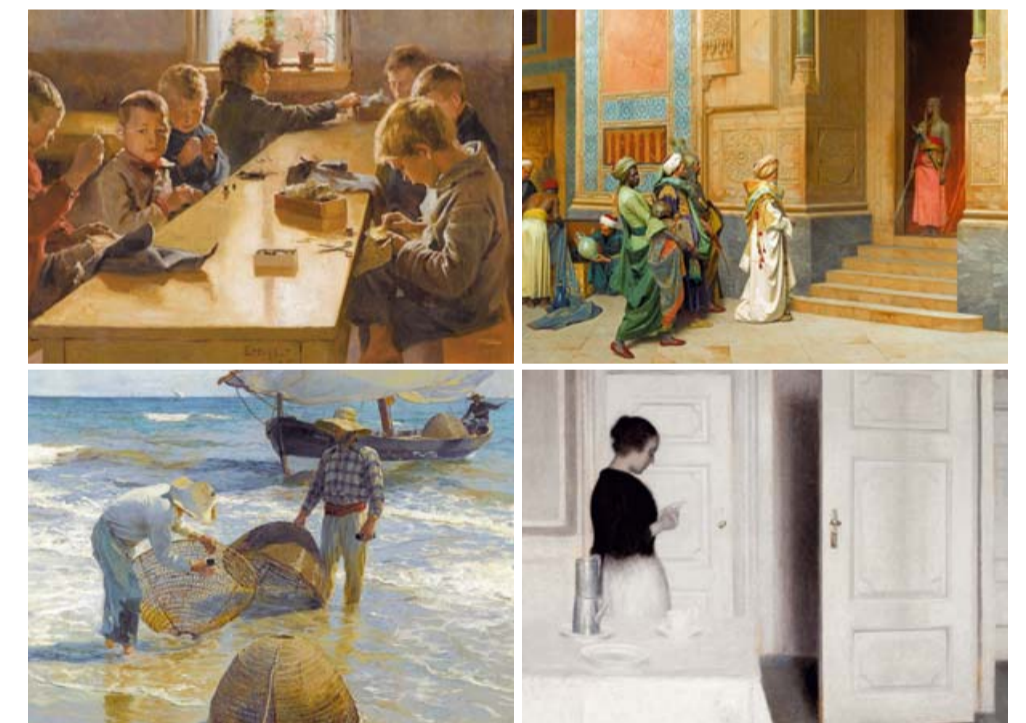
IM UHRZEIGERSINN VON OBEN LINKS: ALBERT EDELFELT „DAS ARBEITSHAUS IN HELSINKI“, VERKAUFT FÜR €536.171 LUDWIG DEUTSCH „DIE VISITE“, VERKAUFT FÜR €2.529.813 VILHELM HAMMERSHÖI „IDA EINEN BRIEF LESEND“, VERKAUFT FÜR €2.131.079 JOAQUÍN SOROLLA „VALENZIANISCHE FISCHER“, VERKAUFT FÜR €4.644.666

WARHOL - KATZ - LICHTENSTEIN www.fluegel-roncak.com 0911 / 787 2330